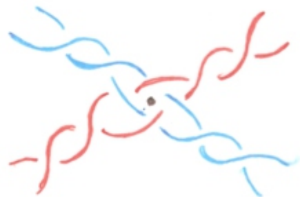
puntos de torchon con una y dos vueltas